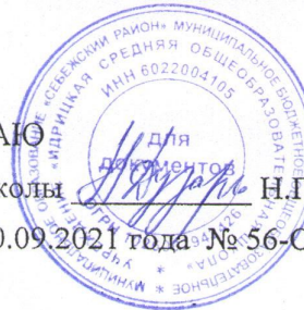
График проведения оценочных процедур в МБОУ «Идрицкая СОШ» в 2021-2022 учебном году